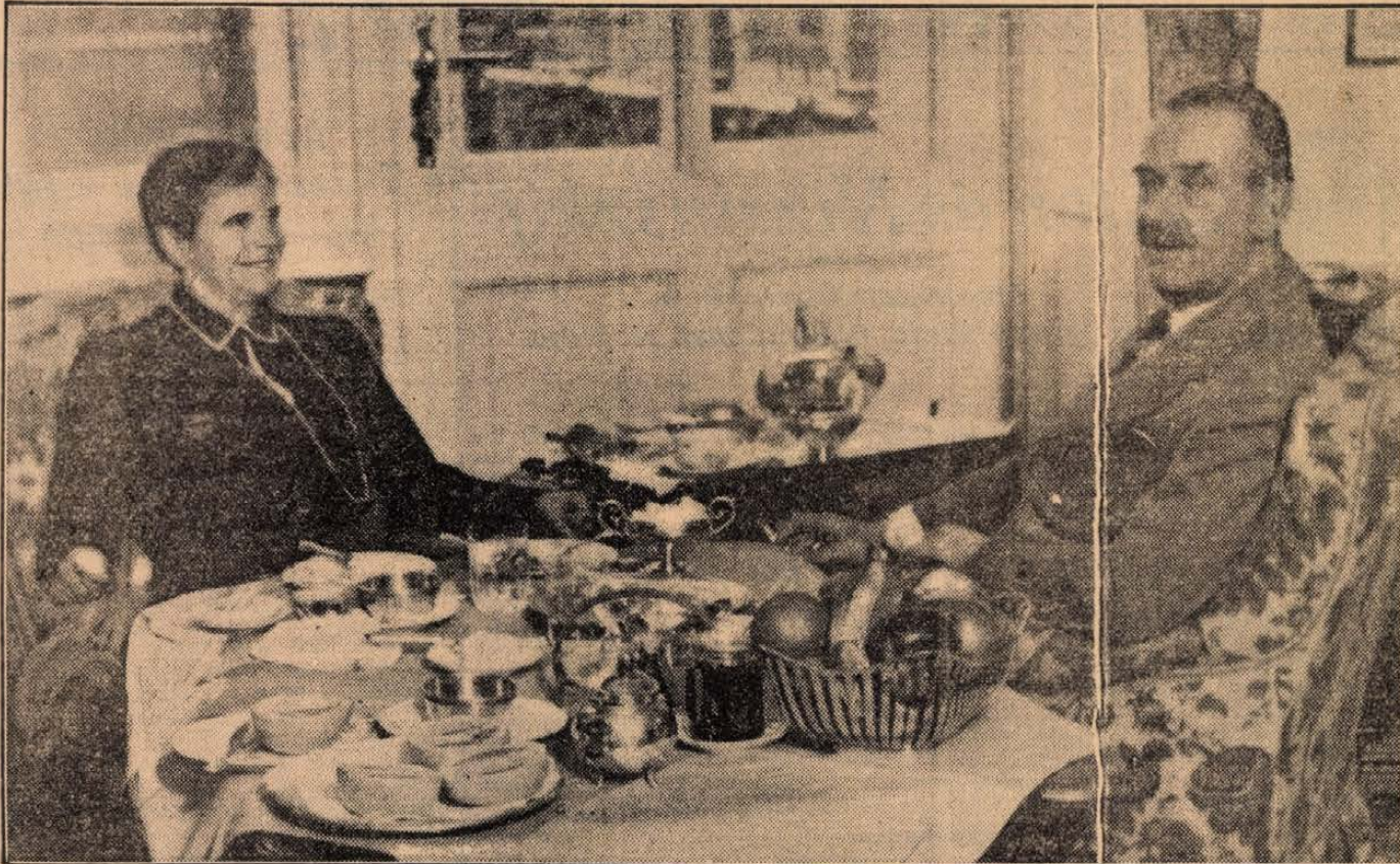
THOMAS MANN ÉS FELESÉGE MA DÉLELŐTT REGGELIKÖZBEN BUDAPESTEN